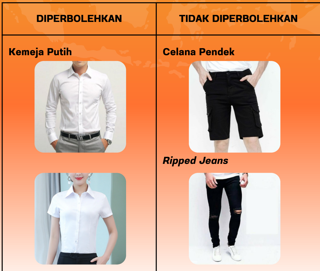
Tabel 1 : Ketentuan Berpakaian Selama Rangkaian Acara PTMB FEB 2023