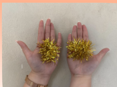
Contoh Pom-pom yang Benar

Aksesoris pom-pom WAJIB dipakai oleh mahasiswa baru selama PTMB FEB 2023 hari pertama (Kamis, 31 Agustus 2023) dan hari kedua (Jumat, 1 September 2023) yang dikenakan bersama atribut lainnya (dasi dan pita kuning). Berikut contoh gambar pom-pom yang benar.