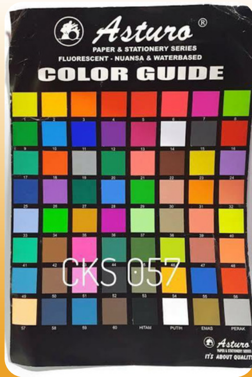
Contoh Katalog Color Guide Kertas Asturo

3. Mahasiswa baru WAJIB membawa pita kuning dengan lebar 3-5 cm . Panjang pita menyesuaikan mahasiswa/i dengan ketentuan bagi mahasiswa (cowok) diikat pada lingkar lengan sebelah kanan sedangkan untuk mahasiswi (cewek) diikat bando pada PTMB FEB 2023 hari pertama (Kamis, 31 Agustus 2023) dan hari kedua (Jumat, 1 September 2023) .