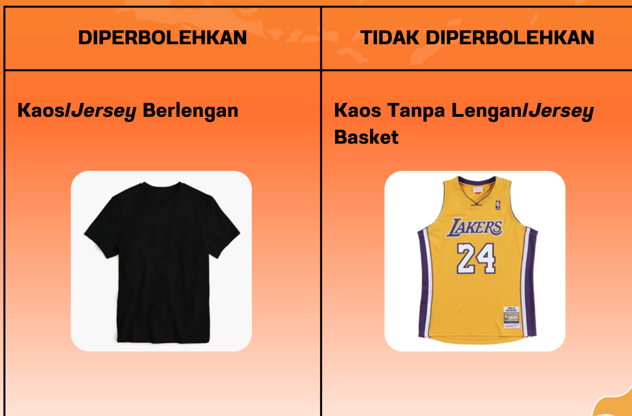
Tabel 2 : Ketentuan Berpakaian untuk Kegiatan FEB Sehat